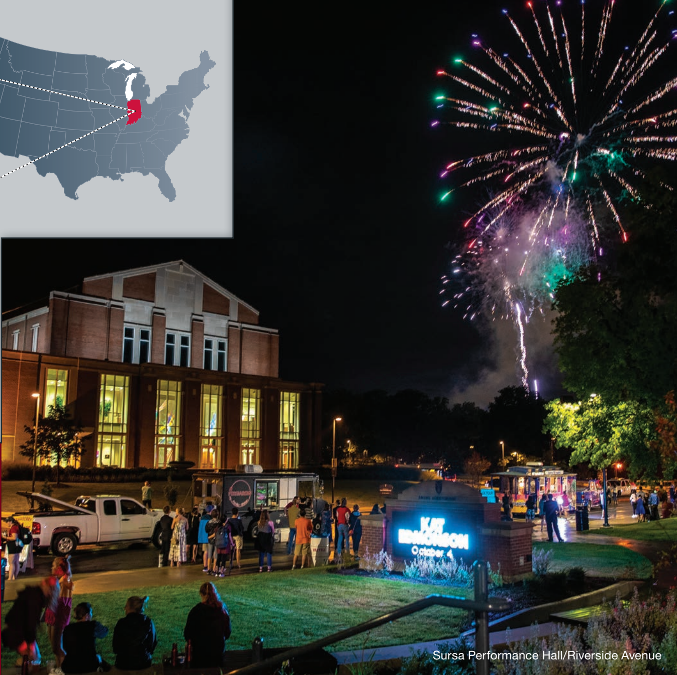
Sursa Performance Hall/Riverside Avenue

425 acres de propiedades para la investigación