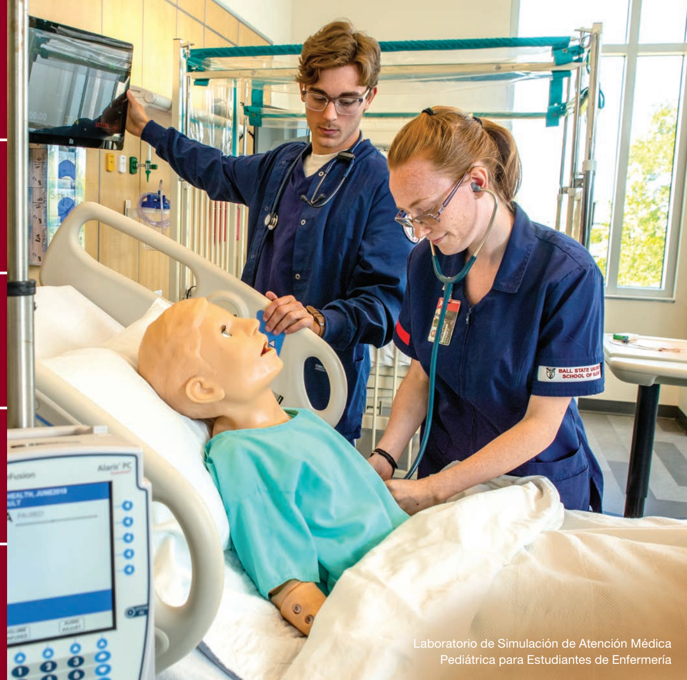
Laboratorio de Simulación de Atención Médica Pediátrica para Estudiantes de Enfermería