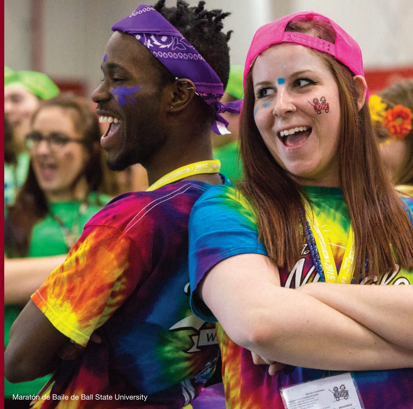
Maratón de Baile de Ball State University