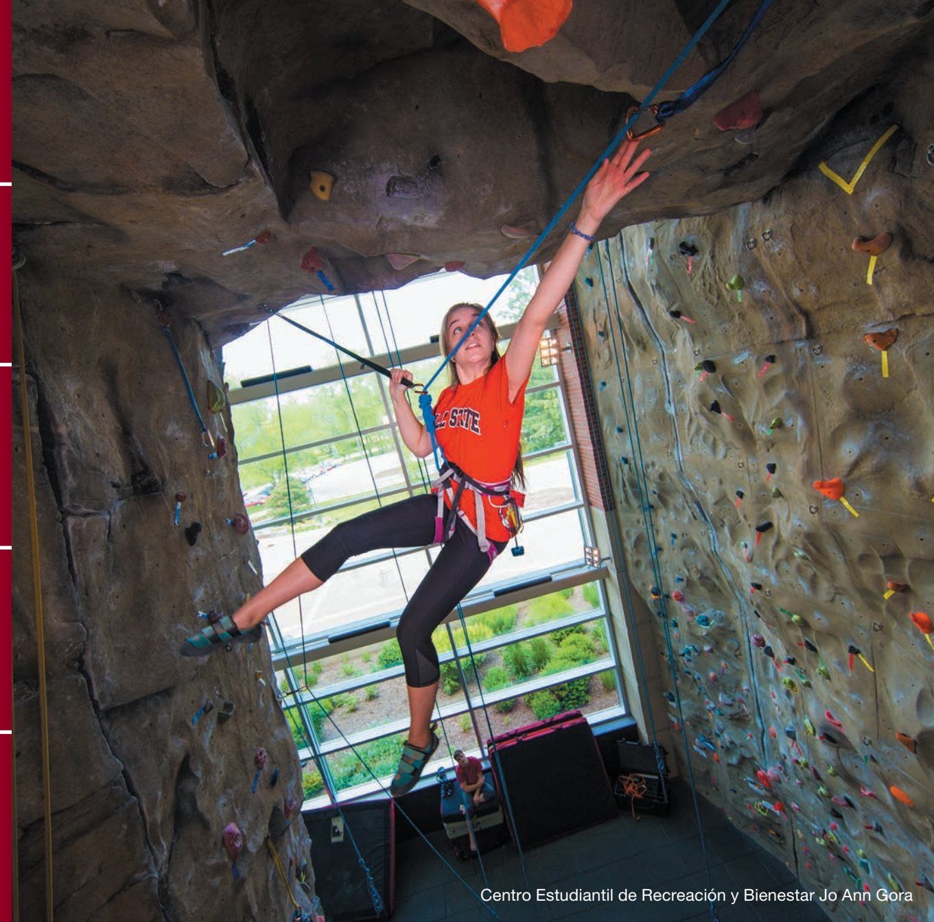
Centro Estudiantil de Recreación y Bienestar Jo Ann Gora

horas de trabajo voluntario estudiantil el último año