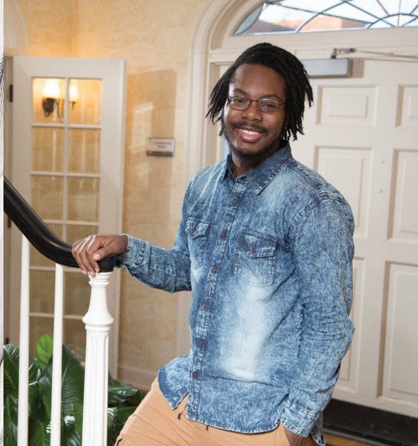
Edmund F. and Virginia B. Ball Honors House

Honors College ofrece un programa integral de honores para estudiantes con un alto nivel de compromiso y logros académicos. Honors College, fundada en 1959, fomenta la innovación en la investigación, la enseñanza y el aprendizaje mediante un plan de estudios de arte liberal creado de manera independiente, un cuerpo docente comprometido y una comunidad educativa activa.